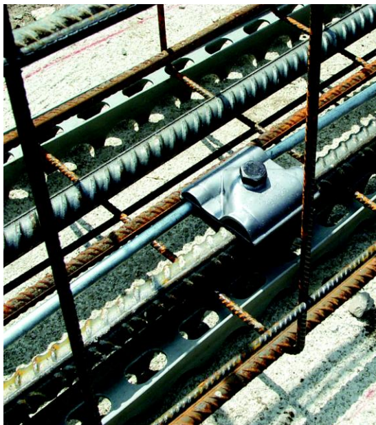
コンクリートに埋め込まれた導体の接続